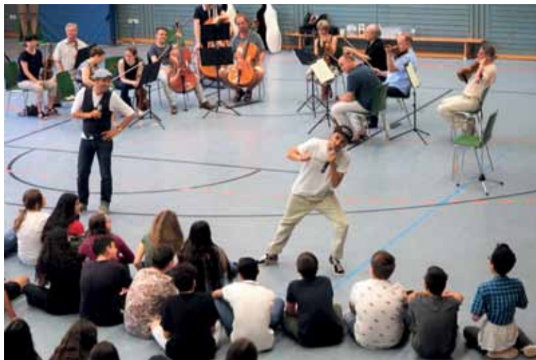
Hip Hop zu klassischer Musik – dazu brauchte es zunächst einmal eine anschauliche Einführung.