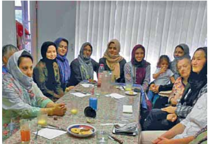
Zum Ende der Fastenzeit für Muslime, dem Ramadan, unterhielten sich die Frauen beim Zuckerfest im Interkulturellen Frauencafé über die unterschiedlichen Fastengewohnheiten und Essenskulturen. Das Frauencafé ist freitags, außer in den Ferien, von 17:00 bis 19:00 geöffnet für Frauen, die Interesse am interkulturellen Austausch haben. Text und Foto: M.K.

Das vierteljährliche Erscheinen der Em-Box verschiebt sich im Oktober auf das Ende des Monats und ab Januar 2019 um jeweils einen Monat, also von Januar auf Februar, von April auf Mai, von