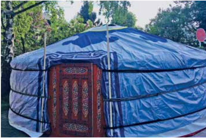
Herzlich willkommen in der Jurte

Kunstworkshops für Familien in den Bergstadtteilen