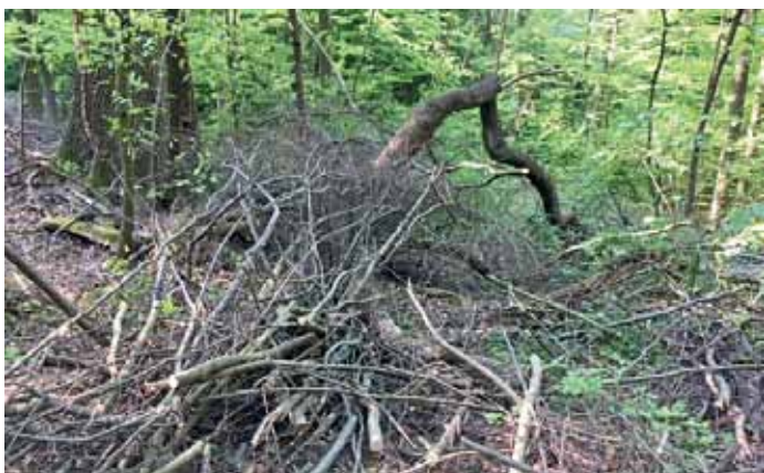
Waldidylle? Das war einmal: Zerfurchter Oberer Neuer Weg

Waldbewirtschaftung auf dem Berg lässt sehr zu wünschen übrig