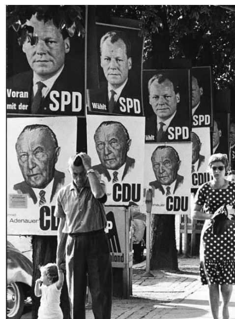
Konrad Adenauer u. Willy Brandt (o.)