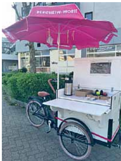
So ähnlich könnte das Fahrradmobil aussehen.

Beim Thema generationsübergreifende Interkulturalität ka-