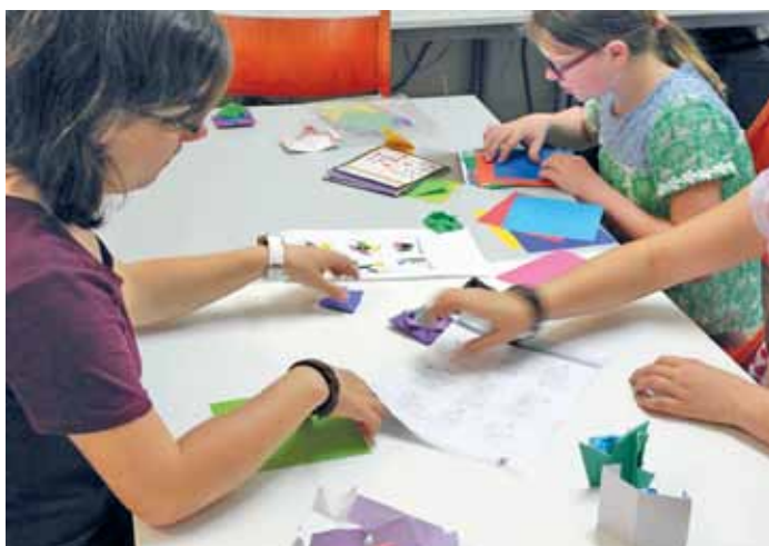
Für diese Papierarbeiten braucht es Konzentration und Geduld.

Kinder- und Jugendzentrum Holzwurm im Boxberg hatte viel Programm im Gepäck