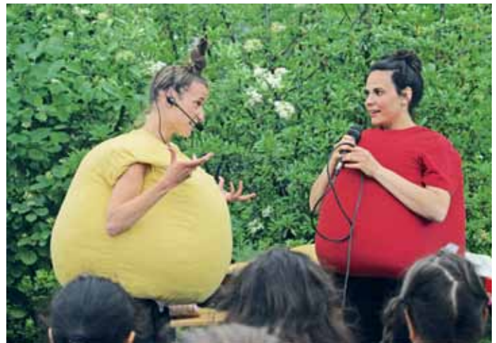
Smart und Pilo im lockeren Gespräch

Jeder Tag endete mit einer großen Siegerehrung. Auch noch Wochen später fragen die Kinder, wann der für den Transport der Spielgeräte umgebaute Reisebus endlich wieder kommt. Rahel Fünfsinn