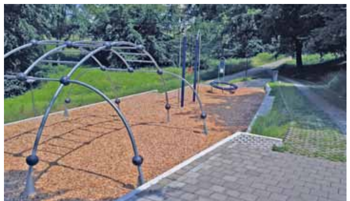
Wie wär's mit etwas Einsatz für diesen Sport-Platz! Alla hopp!

Laut Integriertem Handlungskonzept für den Emmertsgrund soll diese Anlage nicht, wie ursprünglich vorgesehen, weiter ausgebaut werden, da sie in der Bürgerwerkstatt eine niedrige Priorität hatte. Stattdessen soll