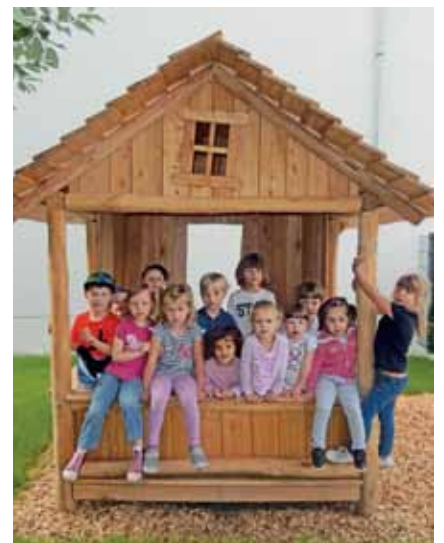
Durch Spenden und mit Unterstützung des Gemeindevereins der Lukasgemeinde konnte eine Holzspielhütte für das neu gestaltete Außengelände angeschafft werden.