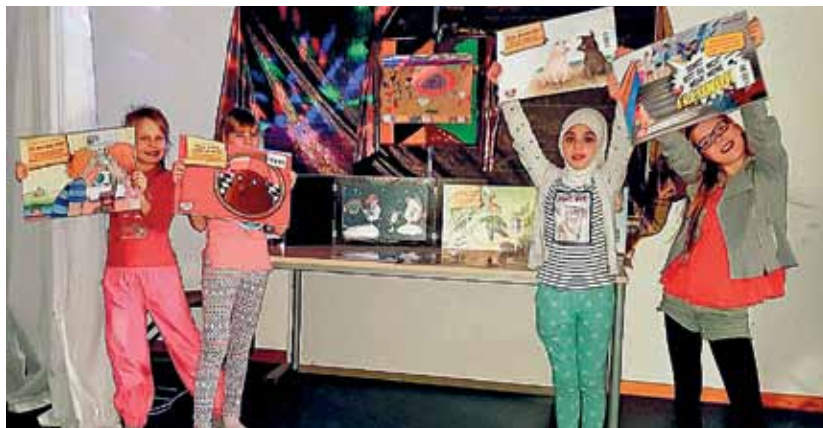
Stolz zeigen Kinder die in einem Spezialformat hergestellten Erzählkarten, mit denen Geschichten zum Leben erweckt werden.

Märchen wie „Der kleine Muck“, Klassiker wie der „Der kleine Wassermann“, moderne Foto-stories, in denen es um tägliche Konflikte in der Schule geht, und