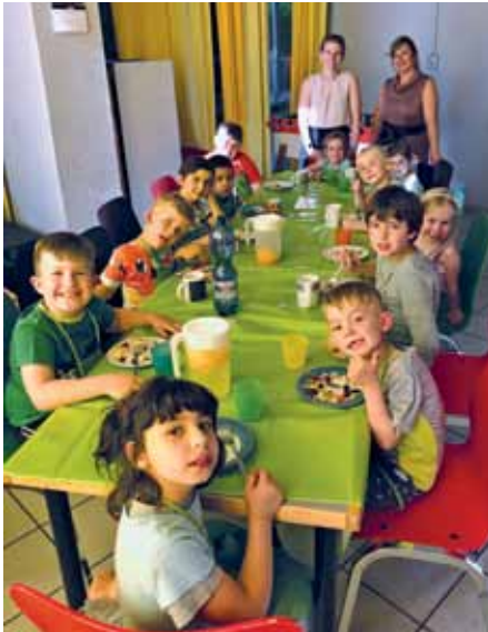
Essen, das man selbst zubereitet hat, schmeckt oft am besten.

Kurse für Kinder zu „Gesundes Essen und Bewegung“