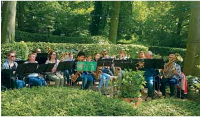
Das Jugendblasorchester Emmertsgrund-Boxberg spielte auf.

ISG-Hotel öffnete zur Sommersaison den Biergarten