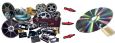
Photo Film Medien

Ihre alten Filme S-8, N-8, 16mm, VHS, HI-8, miniDV, DIAs u.s.w. transferieren wir für Sie auf DVD.