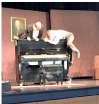
Spiele auf dem Klavier mal anders

ein Präludium von Bach zu spielen unter dessen gestrengem Blick, ob sie Franz Liszt Klavier und gleichzeitig Alhorn spielend erklingen ließen, einen Notenständer zum Hüpfen brachten oder sich eine Tuba über den Kopf stülpten und dabei Klavier spielten – unglaubliche Gags hatten die beiden drauf, meistens in Form von Störmanövern. Mäx in seinem Frack mit fliegenden Schößen wollte solo konzertieren auf dem Klavier, während Gogol ihm mit virtuosen oder akrobatischen Aktionen die Aufmerksamkeit des Publikum zu stehlen wusste. Die Zeit verging im Fluge, und man konnte nur immer wieder staunen über die Vielfalt der In-